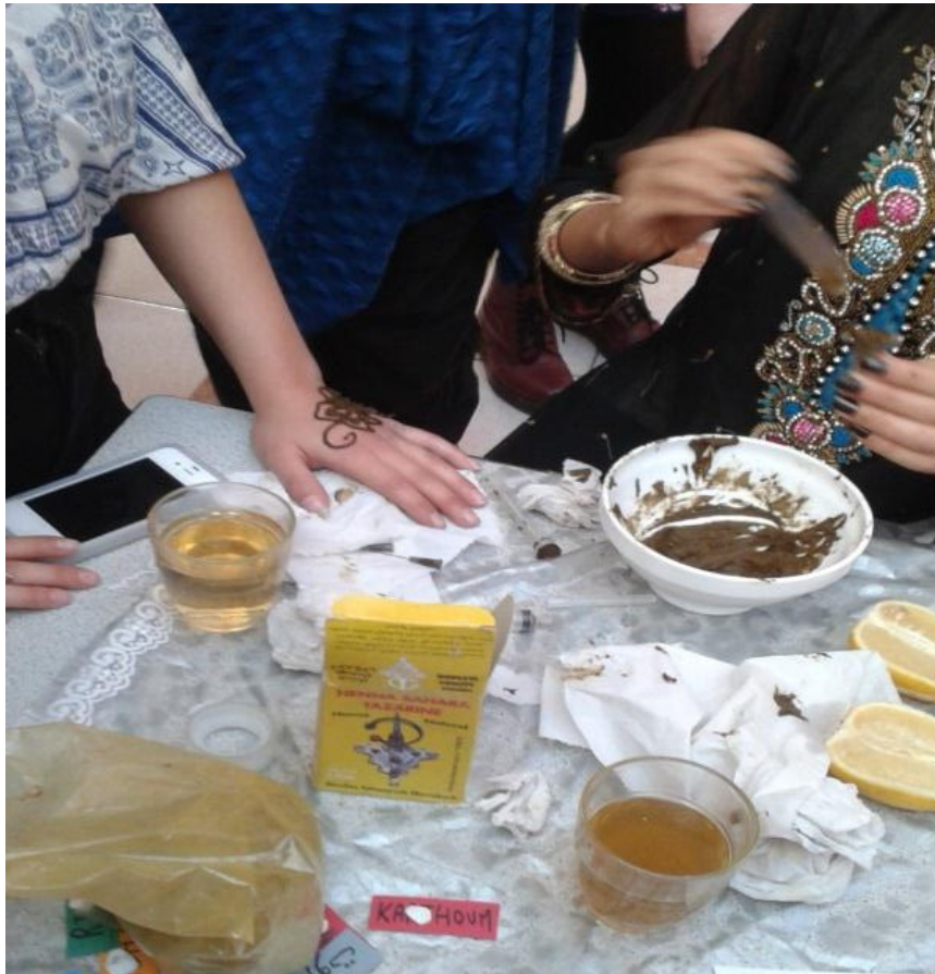
Journée européenne des langues

Je suis étudiante de première Es (section économique) au Lycée International Charles de Gaulle à Dijon. Plusieurs de mes nouveaux amis sont les étrangers - cela nous permet de parler de la vie quotidienne, façon de vivre, habitudes, des styles alimentaires. Il est intéressant de comparer les similitudes et différences dans nos pays. Entre autres je peux découvrir les nouvelles cultures, comparer les systèmes éducatifs et découvrir les différentes activités de loisirs. En même temps nous pouvons partager nos expériences de nos lycées d'origine. Par exemple les étudiants étrangers ont eu l'opportunité de présenter leur pays à l'occasion de la Journée européenne des langues organisé au lycée Charles de Gaulle.