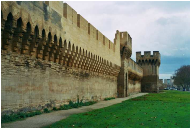
Les remparts autour du centre d' Avignon