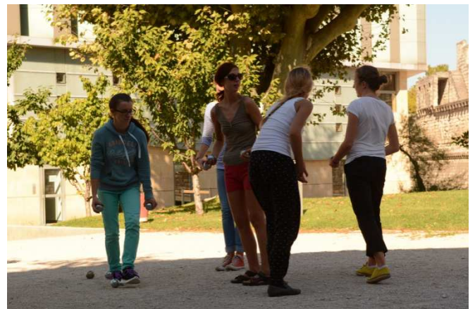
On joue à la pétanque devant l'Université d'Avignon