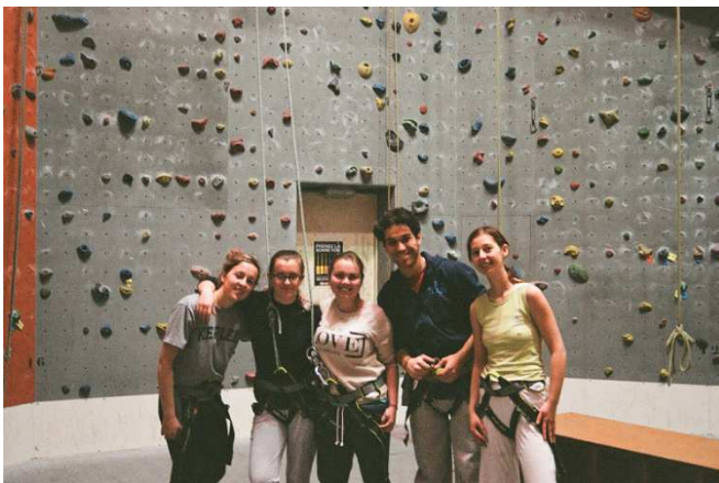
L'escalade avec un prof français et tchèque (il y manque Kokos)