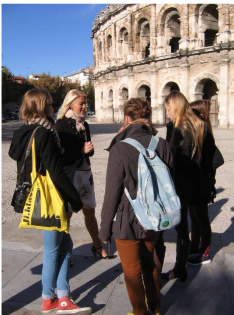
Voyage à Nîmes