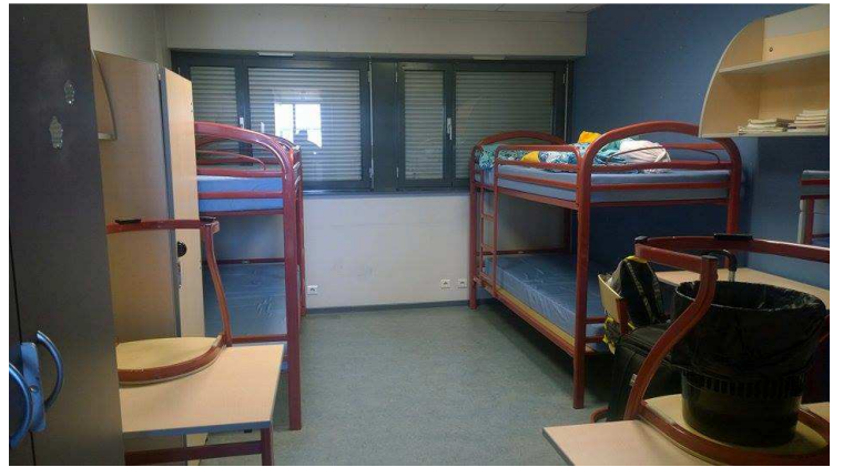
La chambre à l'internat