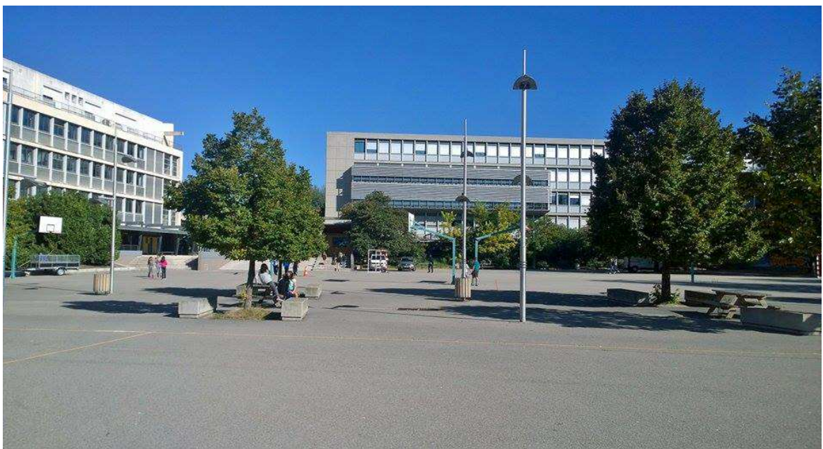
La vue sur la cour du lycée, l'internat est le bâtiment à gauche